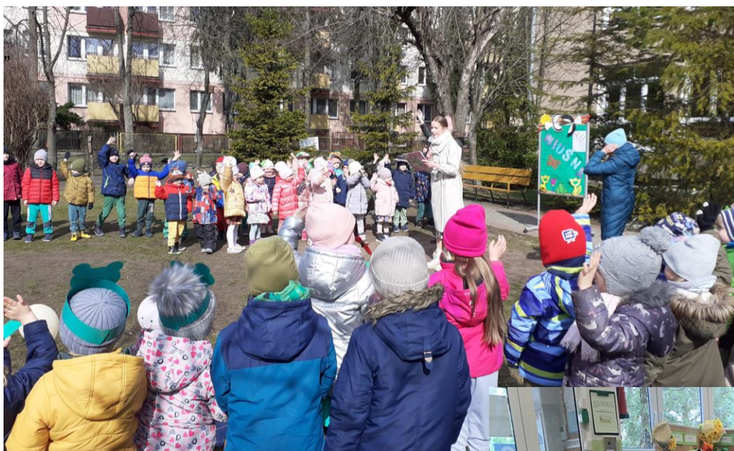
Kapelusz Pani Wiosny