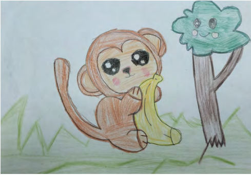
rysunki Natalia Rogólska 2A