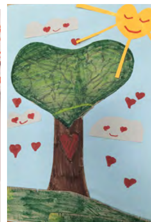
rys.Natalia Rogólska 2A

Walentynki są obchodzone w południowej i zachodniej Europie od średniowiecza. Europa północna i wschodnia dołączyła do walentynkowego grona znacznie później.