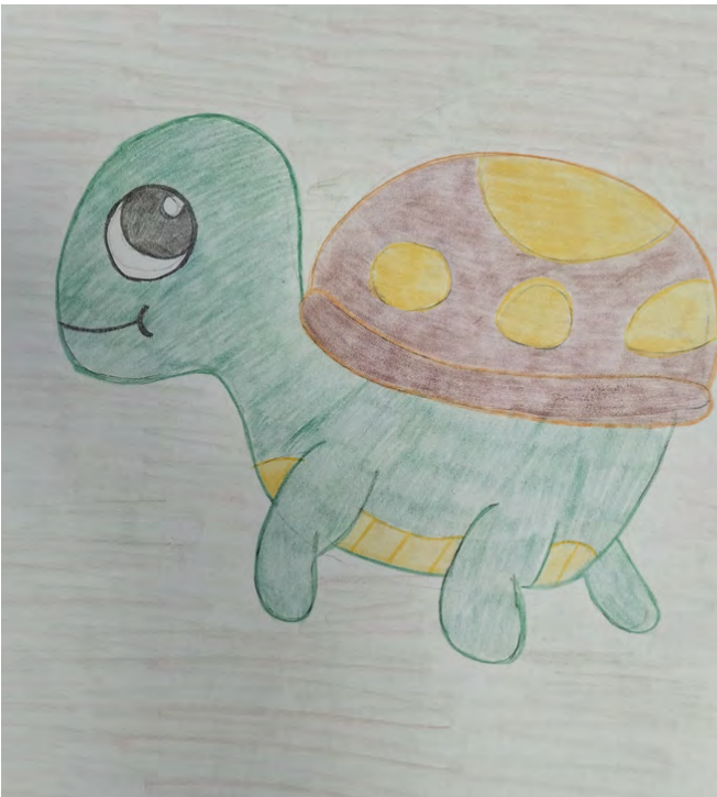
rysunki: Oliwia Wakulińska 2A

Małpy to zwierzęta dosyć szalone, Małpy to zwierzęta o dobrym humorze, Małpy to zwierzęta, które lubią banany, Małpy to zwierzęta, o których dużo słuchamy, Małpy to zwierzęta znane nam z dawnych bajek, Małpy to zwierzęta, które uwielbiamy, Małpy to zwierzęta, które lubią rozrabiać, Małpy to zwierzęta, z którymi czasem się utożsamiam Małpy to zwierzęta, które bardzo lubię Małpy to zwierzęta, których nigdy nie porzucę.