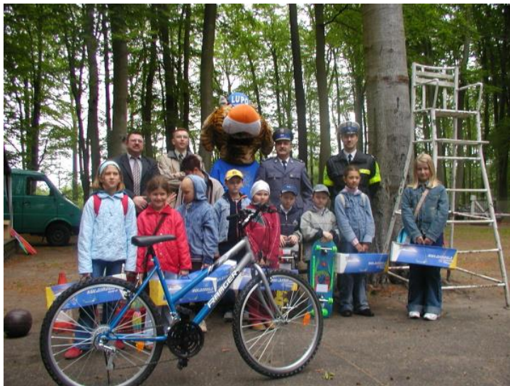
Na pikniku w Zdroisku