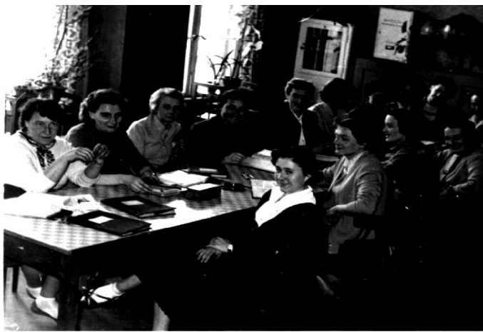
Grono pedagogiczne w roku szkolnym 1958/59.

Pomimo kłopotów lokalowych i materialnych w szkole pracowało wiele kół zainteresowań oraz Samorząd Uczniowski. W dalszym ciągu sukcesy odnosił zespół muzyczny i taneczny. Ze względu na brak odpowiedniej świetlicy, auli i sali gimnastycznej młodzież uczęszczała na zajęcia pozalekcyjne do Domu Harcerza i tam rozwijała swoje zainteresowania np. w kole fotograficznym czy szachowym. Uczniowie włączyli się finansowo w budowę pomnika Adama Mickiewicza. Zebrano 266 zł. W roku szkolnym 1958/59 Samorząd Uczniowski i Komitet Rodzicielski przyłączył się do akcji „1000 szkół na 1000 – lecie”. Zebrano ponad 4000 zł, które wpłacono na konto Miejskiego Komitetu Budowy Szkół.