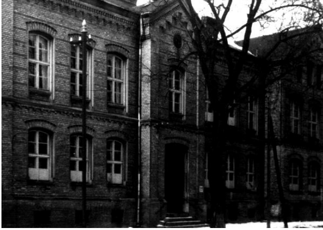
Budynek Szkoły Podstawowej nr 4 w 1946 r.