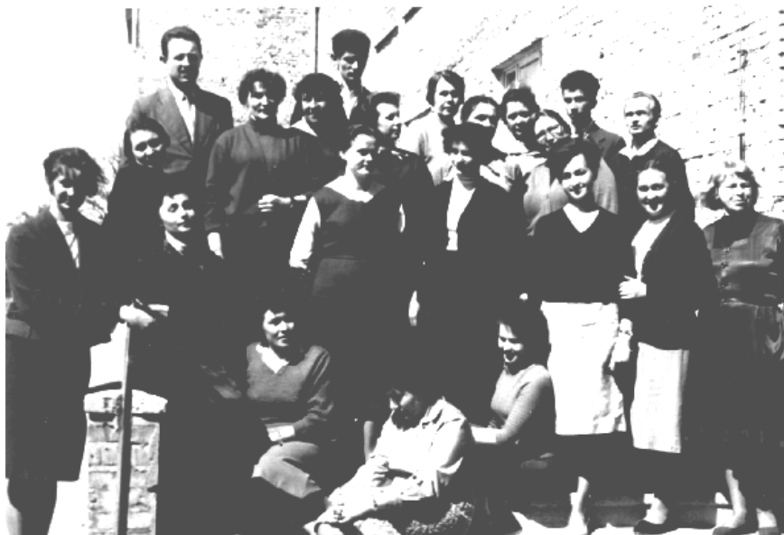
Grono pedagogiczne w roku szkolnym 1960/61

Praca dydaktyczno – wychowawcza przebiegała bez zarzutu. Młodzież włączyła się aktywnie do obchodów Roku Kopernikowskiego i Tysiąclecia Państwa Polskiego.