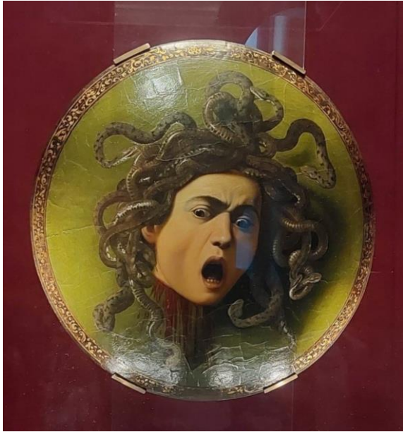
Caravaggio - La Medusa (mal'ba na štíte)

Česka, Holandska i Estónska. Rozprávali sme sa aj o školských systémoch, fungovaní školstva v zahraničí a podelili sme sa pomocou prezentácií a videí o krásy našich krajín.