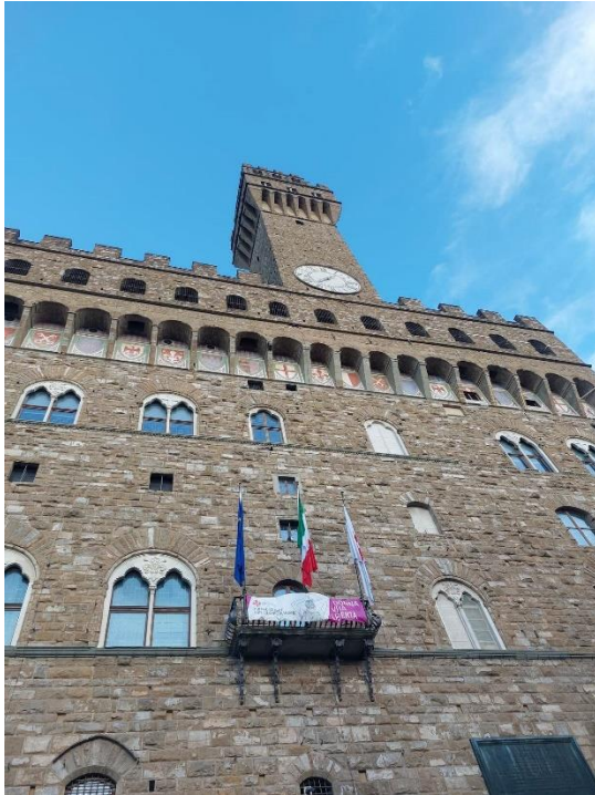
Palazzo Vecchio - sídlo Medicejovcov

Po roku, takmer na dátum presne, som sa vrátila do Florencie. Do tohto úžasného, pre mňa asi najkrajšieho mesta na svete. Zúčastnila som sa týždenného vzdelávania na tému Discovering Renaissance Art in Florence (Zážitkové objavovanie renesančného umenia vo Florencii) .