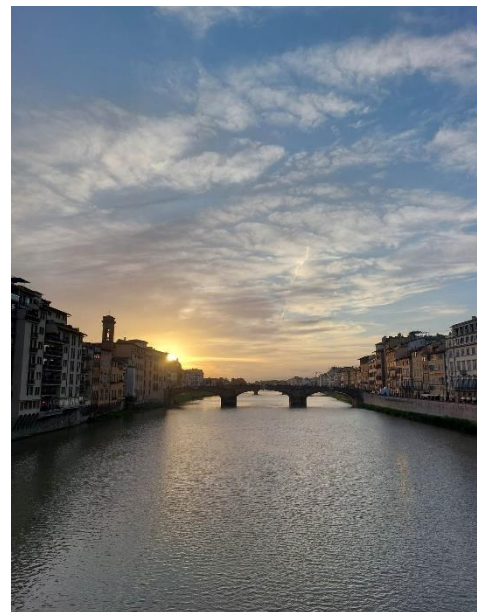
Il Ponte di Santa Trinitá