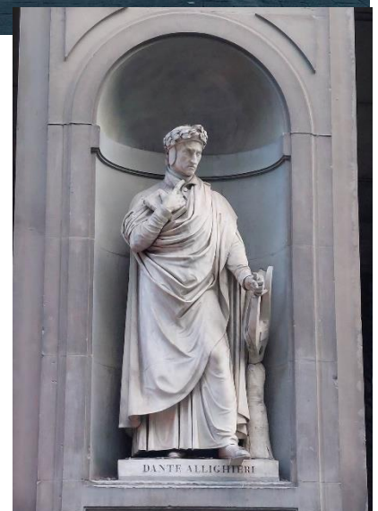
Socha Danteho Allighieriho pred galériou Uffizi