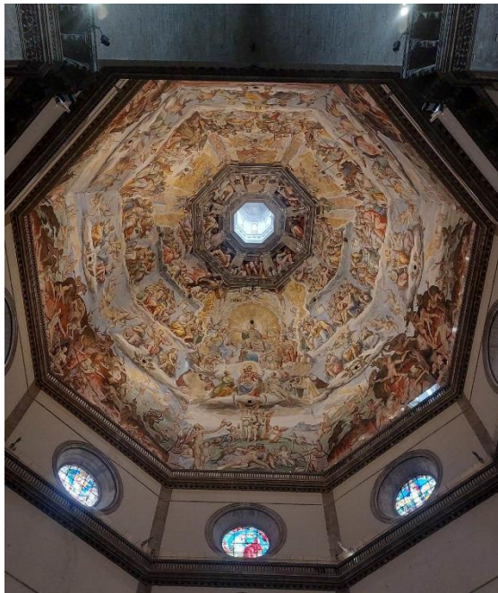
Freska v kupole Dómu Santa Maria del Fiore