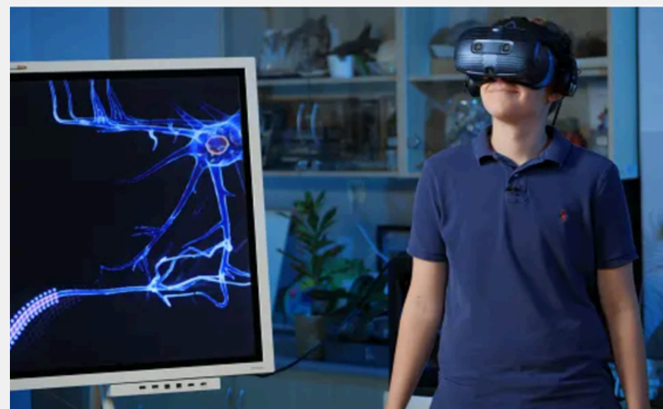
fol. Nowa Era