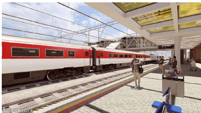
Modernizácia železničnej stanice Vrútky