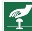
PRZYCIŚK AWARYJNEGO ZATRZYMANIA