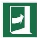
PCIAĆ Z PRAWEJ, ABY OTWORZYĆ