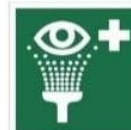
PRYSZNIC DO PRZEMYWANIA OCZU