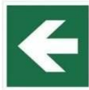
KIERUNEK DROGI EWAKUACYJNEJ