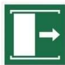
PRZESUNĄĆ W PRAWO, ABY OTWORZYĆ