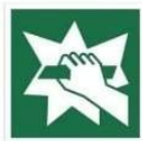
STĘC, ABY UZYSKAĆ DOSTĘP