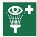
PRYSZNIC DO PRZEMYWANIA OCZU