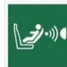
SYSTEM DETEKCYI OBECNOŚCI I POŁOŻENIA FOTELIKA