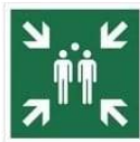
MIEJSCE ZBIÓRKI DO EWAKUACJI