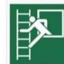
OKNO EWAKUACYJNE Z DRABINĄ