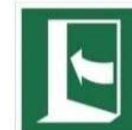
PCIAĆ Z LEWEJ, ABY OTWORZYĆ