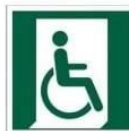
WYJŚCIE EWAKUACYJNE DLA OSÓB NIEZDOLNYCH DO CHODZENIA