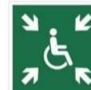
MIEJSCE ZBIÓRKI DLA INWALIDÓW