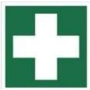
PIERWSZA POMOC MEDYCZNA