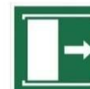
PRZESUNĄĆ W PRAWO, ABY OTWORZYĆ