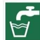
WODA ZDATNA DO PICIA