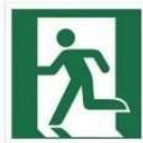
WYJŚCIE EWAKUACYJNE LEWOSTRONNE