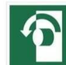
PRZEKRĘCIĆ W LEWO, ABY OTWORZYĆ