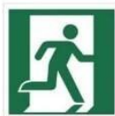
WYJŚCIE EWAKUACYJNE PRAWOSTRONNE