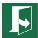
CIĄGNĄĆ Z LEWEJ, ABY OTWORZYĆ