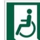
WYJŚCIE EWAKUACYJNE DLA INWALIDÓW