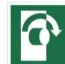
PRZEKRĘCIĆ W PRAWO, ABY OTWORZYĆ