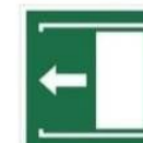
PRZESUNĄĆ W LEWO, ABY OTWORZYĆ