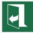
CIĄGNĄĆ Z PRAWEJ, ABY OTWORZYĆ