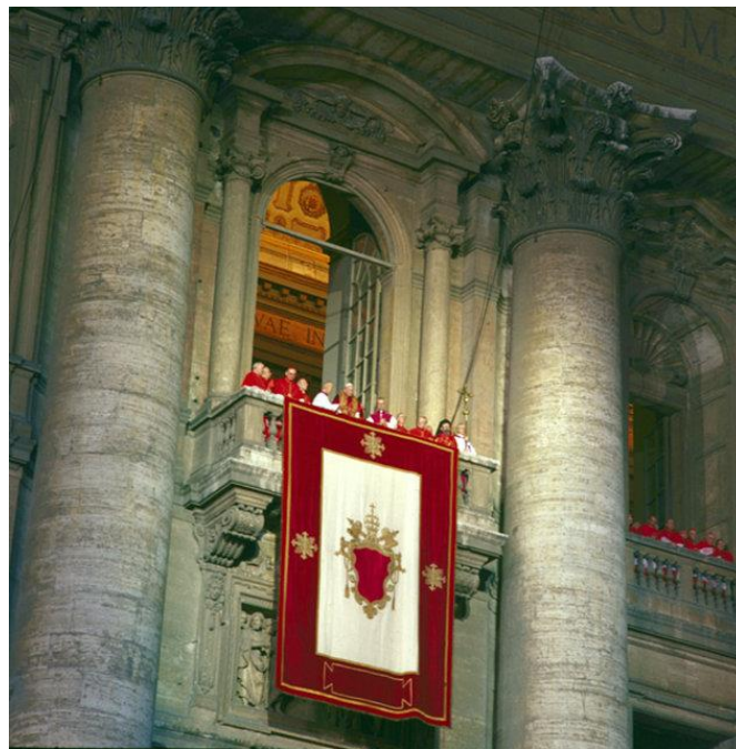
Fot. Karol Wojtyła jako Jan Paweł II na balkonie bazyliki św. Piotra w dniu wyboru.

Na zwołanym po śmierci Jana Pawła I drugim konklawe w roku 1978 Wojtyła został wybrany na papieża i przybrał imię Jana Pawła II. Wynik wyboru ogłoszono 16 października o godzinie 16:16. Formalna inauguracja pontyfikatu miała miejsce w trakcie mszy św. na placu Św. Piotra 22 października 1978.