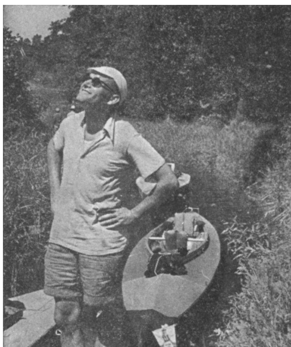
Fot. Karol Wojtyła na spływie kajakowym.

Karol Wojtyła powrócił do przerwanych obowiązków. Wykładał m.in. w seminariach diecezji: krakowskiej, katowickiej i częstochowskiej (mieściły się one wszystkie w Krakowie) oraz na Katolickim Uniwersytecie Lubelskim. Jego wykłady obejmowały głównie teologię moralną i etykę małżeńską, ale ogarniały też szeroko