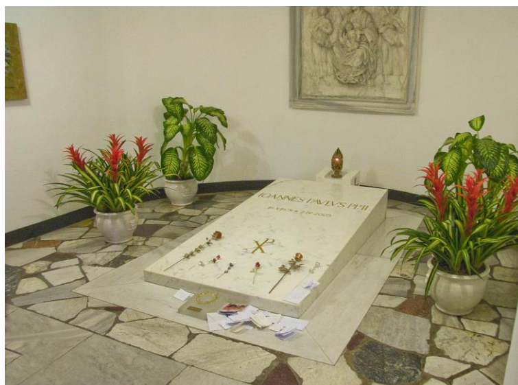
Fot. Grobowiec w Grotach Watykańskich (Pierwsze miejsce pochówku Jana Pawła II).