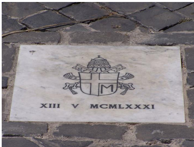
Fot. Płyta na placu św. Piotra w miejscu, w którym dokonano zamachu na Jana Pawła II.