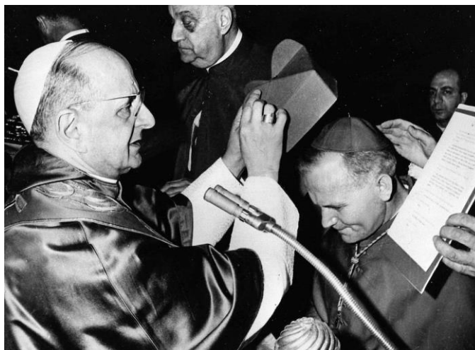
Fot. Proklamacja kardynała Karola Wojtyły przez papieża Pawła VI, czerwiec 1967 r.