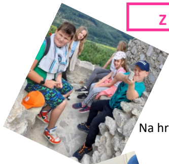
Na hrade Hrušov