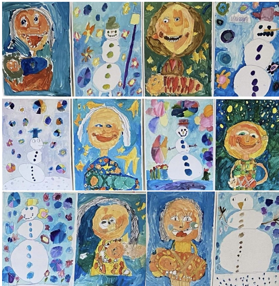
Práce žiakov ZUŠ