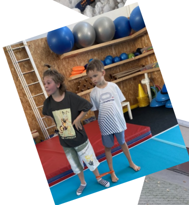
Gymnastická telocvičňa preverila naše akrobatické kúsky.