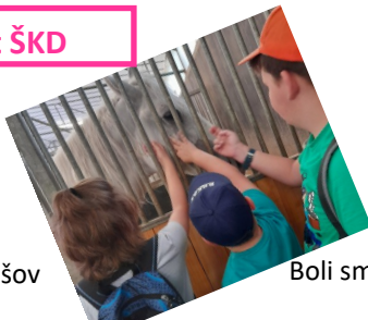
Boli sme aj v Žrebčine.