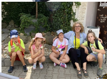
Na výlete v Bojniciach