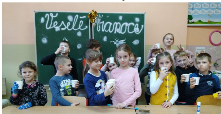
V čase medzi chrípkou a Vianocami sme stihli vianočný večierok.