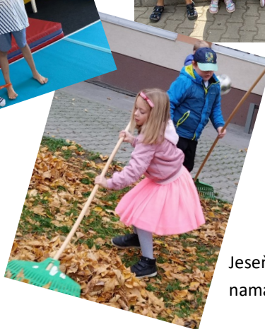
Jeseň na školskom dvore je namáhavá, ale krásna.