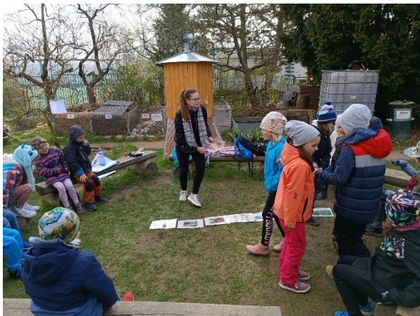
Noc s Andersenem