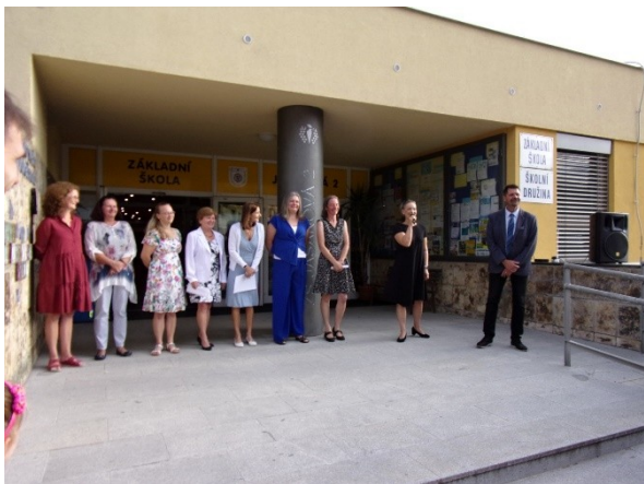
Výjezd na Rab – září 2022