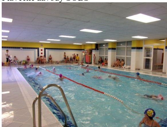
Plavecké závody SOBŠ