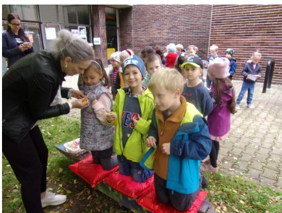
Pasování na čtenáře