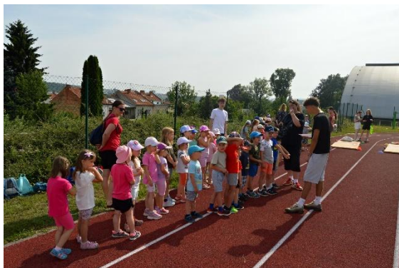
Sportovní den pro MŠ Dubová