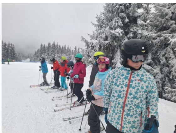
LVK 2. stupeň