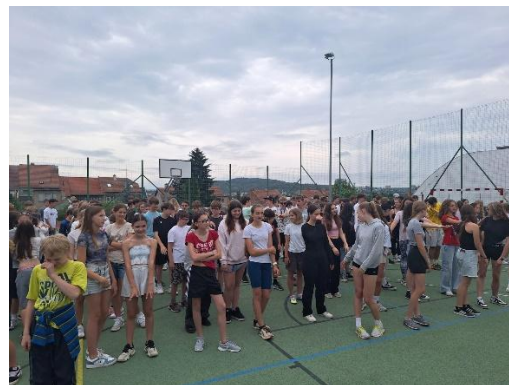
50 let – úvodní taneček