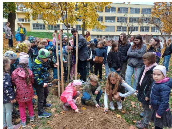
Sázení jasanu k 50. nám