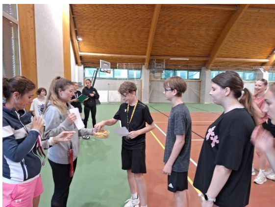
50 let – sportovní turnaj