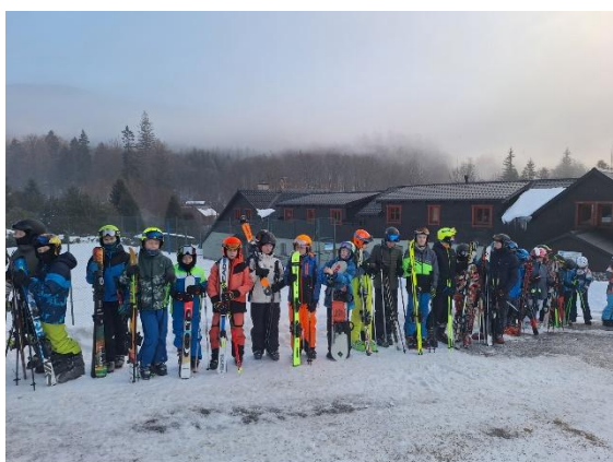
LVK 1. stupeň