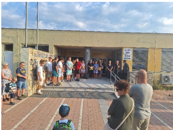
Zahájení školního roku