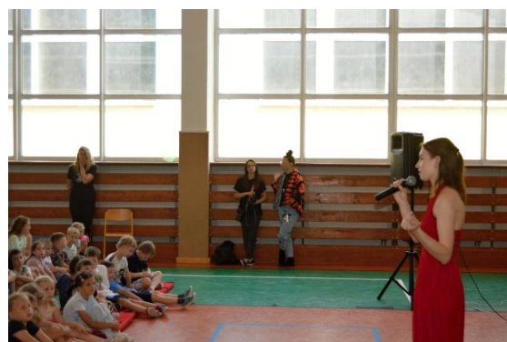
50 let – besedy