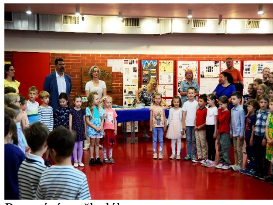
Pasování na školáky