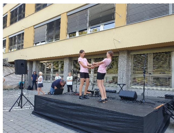
50 let – vystoupení žáků