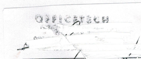
Szabolcs Aranyossy - OFFICETECH